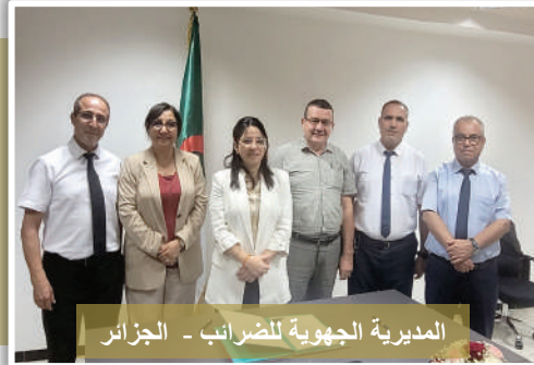
المديرية الجهوية للضرائب - الجزائر