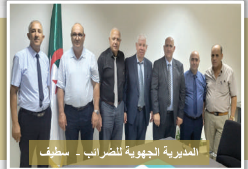
المديرية الجهوية للضرائب - سطيف