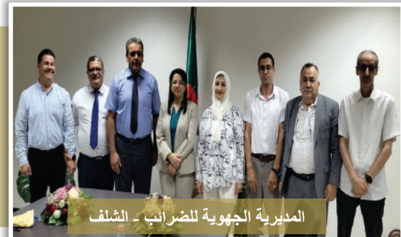
المديرية الجهوية للضرائب - الشلف