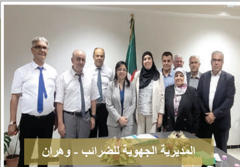
المديرية الجهوية للضرائب - وهران