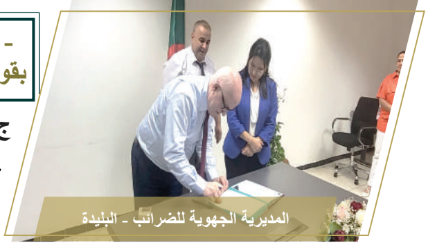
المديرية الجهوية للضرائب - البليدة

الأخير يعتبر وسيلة لتنفيذ أحكام القانون العضوي المذكور. حيث يهدف عقد الأهداف والأداء الى متابعة وتقييم الأنشطة التي تقوم بها المديرية العامة للضرائب في إطار التسيير القائم على الأداء، وذلك بغية تعزيز وتحسين شفافية وفعالية وكفاءة المصالح الجبائية ومساءلة المسيرين عن النتائج التي تم الحصول عليها وكذا قياس هذا الأداء باستخدام مؤشرات النجاعة. في هذا الصدد، تم تخصيص للإدارة الجبائية برنامج تحت عنوان " الضرائب " والذي ينقسم بدوره الى برنامجين فرعيين الأول " الوعاء، التحصيل والرقابة" والثاني " الدعم الإداري". ومن هذا المنطلق وباعتباري مسؤولة البرنامج تم إسنادي رسالة مهام مفضية من طرف السيد وزير المالية، مرفقة بعقد الأهداف والأداء الذي يعتبر التزام لتحقيق الأهداف المحددة للإدارة الجبائية على مدار ثلاث سنوات.