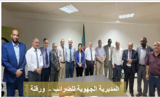
المديرية الجهوية للضرائب - ورقلة

ج- تماشيا مع توجهات السلطات العليا للبلاد الهادفة الى إرساء مبادئ الحوكمة الرشيدة للمالية العمومية التي تجسدت على أرض الواقع بدخول أحكام القانون العضوي رقم 18-15 المؤرخ في 2 سبتمبر 2018 المتعلق بقوانين المالية حيز التنفيذ، قامت المديرية العامة للضرائب بتاريخ 21 و 22 ماي لسنة 2023 بتنظيم ندوة سنوية لإطارات الإدارة الجبائية تحت عنوان "التسيير بالنجاعة" متبينة بذلك نهج التسيير القائم على الأداء الموجه نحو بلوغ الأهداف على مدى ثلاث سنوات. يندرج هذا النهج في إطار الاصلاحات المعتمدة من طرف