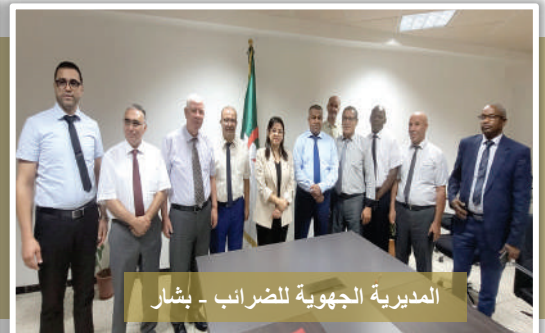
المديرية الجهوية للضرائب - بشار